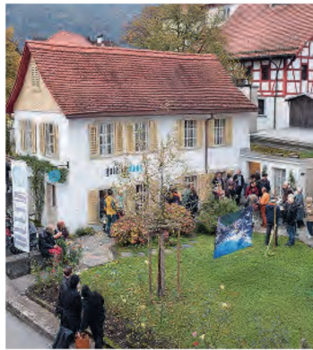
Aussenansicht mit Werk «Hinnä fürä» der Ausstellung Echos